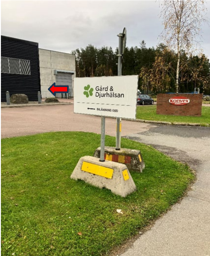
1. Gård & Djurhälsans skylt vid Konvex.