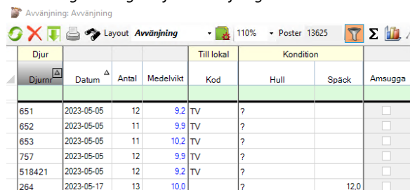
Bild 2. Suggkort, nollavvänjning