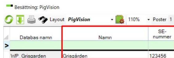
Bild 1. Besättningsnamn