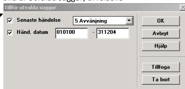
Bild 2. Utvalda suggor