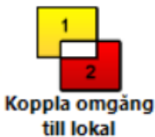
Koppla omgång till lokal

Skapa omgången under denna ikon. Ge omgången en Kod som gör att du enkelt kan förstå vilken omgång det är. Fyll i Start datum som är det datum grisarna sattes in, och Till datum som söndagen tömningsveckan (alternativt det datum som sista skicket för den omgången är registrerade på under Slakt grupp).