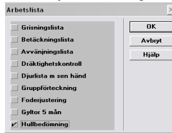
Bild 6. Ange griseringsgrupp