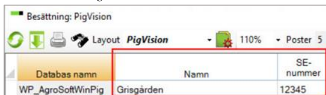
Bild 1. Besättningsnamn

Namn – företaget eller gårdens namn SE-nummer – produktionsplatsnummer