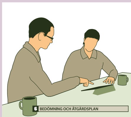
6 BEDÖMNING OCH ÅTGÄRDSPLAN

Veterinären besöker besättningen och går igenom smittskyddet steg för steg tillsammans med grisföretagaren.