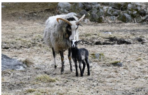
Figur 1. Viruset smittar effektivt från moderdjur till avkomma.

MV är en virussjukdom som drabbar får och get (getens variant kallas CAE - Caprin Artrit Encephalit). Sjukdomen kan ge flera olika symtom beroende på vilket organ som angrips. Ofta angrips lungorna hos fåren men även det centrala nervsystemet kan drabbas vilket då ger vinglighet. Kronisk avmagring är ett annat vanligt symtom och även leder och juver kan angripas med inflammationer som följd. Viruset sprids via