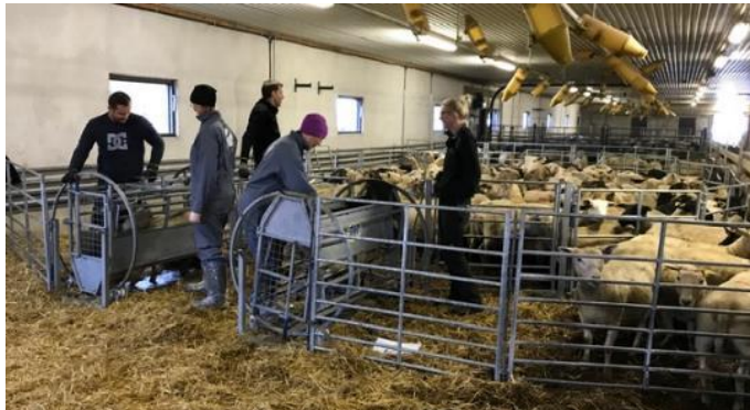
Figur 1. Klövkontroll av Gård & Djurhälsans veterinärer.

Vid anslutning till Klövkontrollen undersöker en veterinär, som är specialutbildad i klinisk fotrötediagnostik, alla klövar på samtliga livdjur i besättningen och provtagning avseende D. nodosus inklusive virulensstestning utförs. Under genomgången tar djurägaren aktiv del av klövinspektionen för att få kunskap om hur friska klövar ska se ut och vilka avvikelser som kan förekomma. Detta är en förutsättning för att djurägaren sedan ska kunna utföra klövkontrollerna nästkommande år i sin egen besättning.