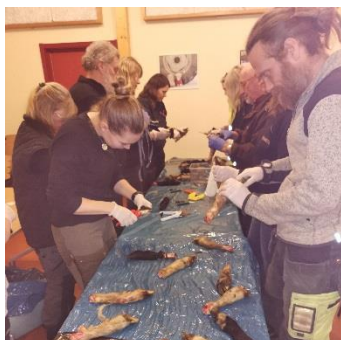
Figur 2. Fårägare övar klövklippning på slaktklövar på klövkurs.